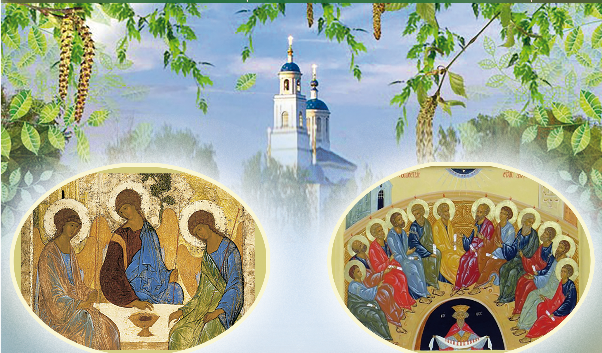
Икона Троица – явление трех Ангелов Аврааму